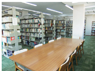
2階 閲覧室・自習コーナー Reading room and self-study corner on the 2nd floor

Library also contains 20 Japanese magazines and 4 foreign magazines.