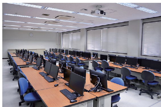
情報処理演習室3 Seminar Room 3