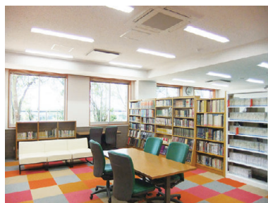
1階 閲覧室・自習コーナー Reading room and self-study corner on the 1st floor