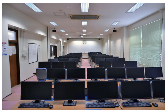
情報処理演習室1 Seminar Room 1