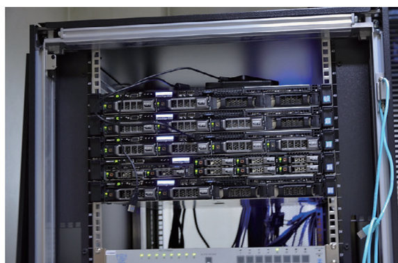
演習室用サーバ Servers for Seminar Rooms

Information Processing Seminar Rooms consist of the following; Seminar Room 1 in the general information building, Seminar Room 2 in the north building for the main building, and Seminar Room 3 in the information engineering building.