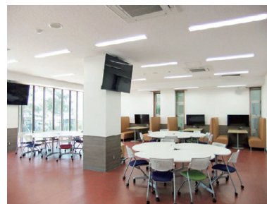
1階 ラーニングcommons Learning commons on the 1st floor